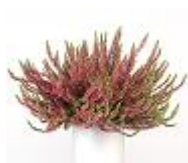
3 dressé large à étalé