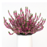
2 dressé large