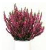
1 dressé étroit