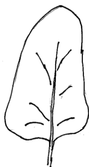
1 ausente o muy débil