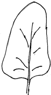
1 fehlend oder sehr gering