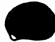
9 très dense