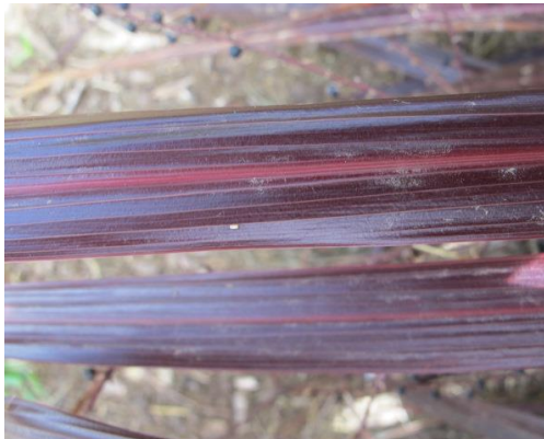
1 principalement sur la partie médiane

La couleur secondaire n'est présente que sous forme de stries.