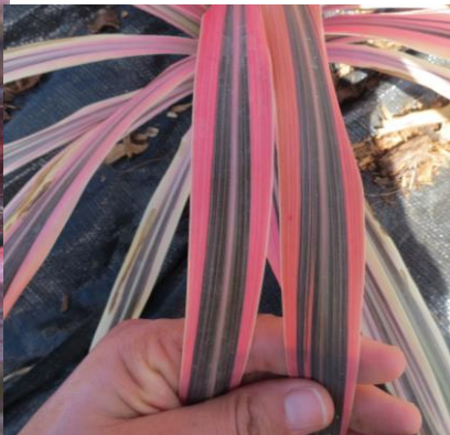
2 sur le bord et sur la partie médiane