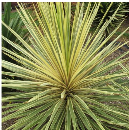
2 dressé et perpendiculaire