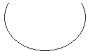
3 fortement concave