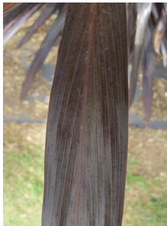
2 formant un angle