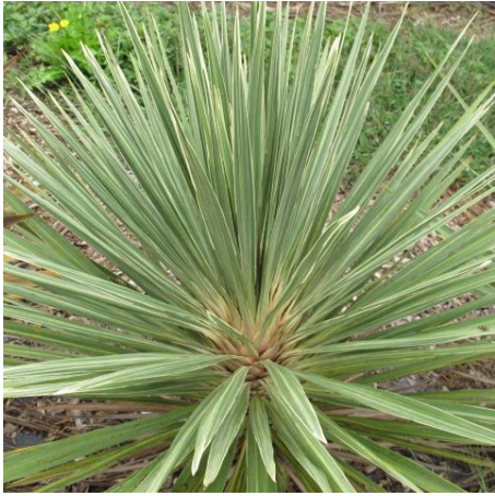
1 nulle ou très faible