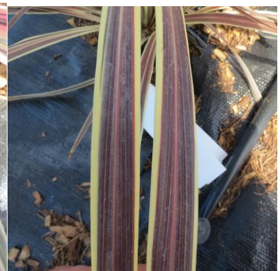
3 principalement sur le bord