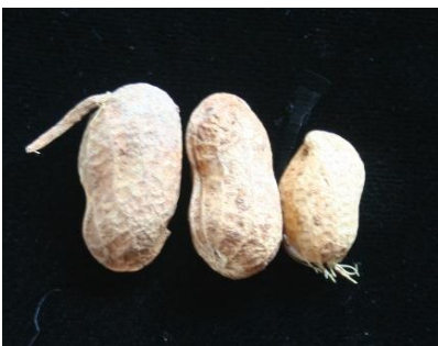
1 absent ou très faible