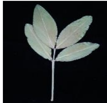
modérément vers le sommet