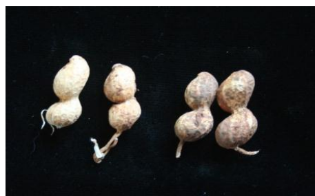
5 très fort