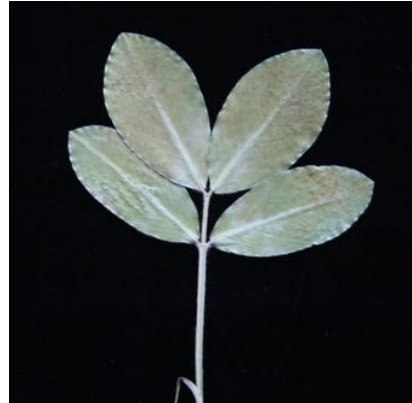
2 en pointe large