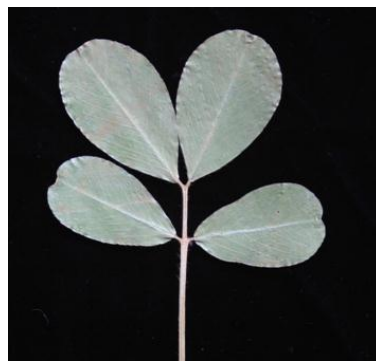
3 fortement vers le sommet