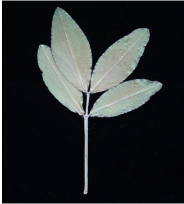
1 en pointe étroite