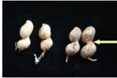
5 très fort