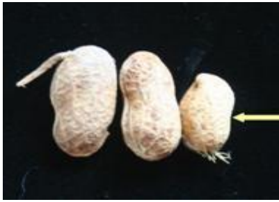
1 absent ou très faible