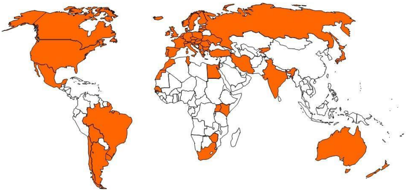
Figure 1 Carte des pays participants aux Systèmes des semences de l'OCDE (2016)