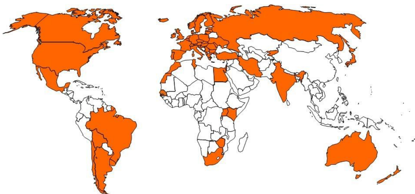
Figure 1 Carte des pays participants aux Systèmes des semences de l'OCDE (2016)