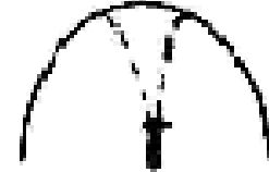
3 weit unterhalb