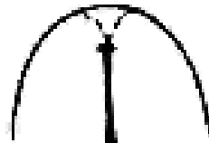
2 leicht unterhalb