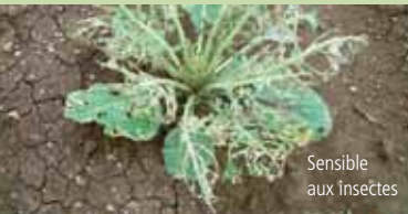
Sensible aux insectes