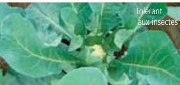
Tolérant aux insectes

La sélection végétale assure la sécurité des récoltes grâce à l'introduction de résistances multiples.