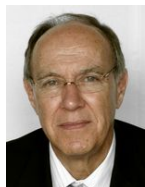
Francis GURRY, Secretary-General