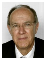
Francis GURRY, Secretary-General