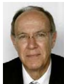
Francis GURRY, Secretary-General